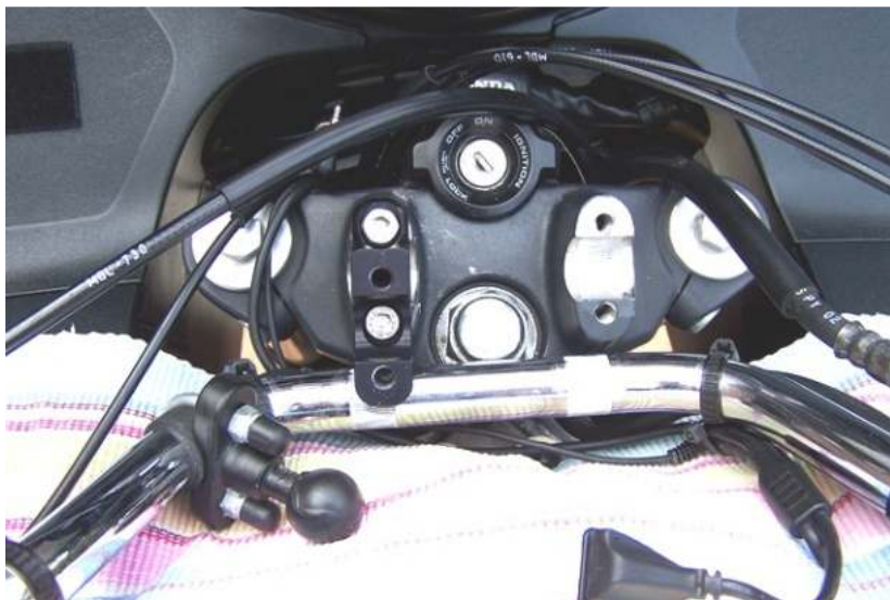
De nieuwe verhogers monteren.