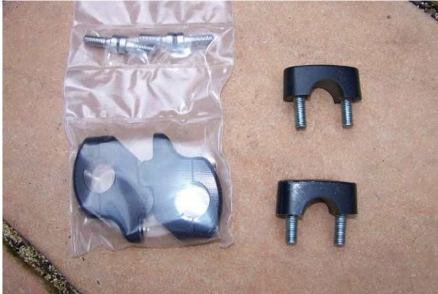
De nieuwe verhogers en de oude stuurklemmen.